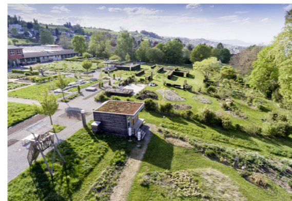
Gelände der ZHAW in Wädens

Der Ausspruch «nichts ist so beständig wie der Wandel» des griechischen Philosophen Heraklit passt bestens zur Umgebung der Zürcher Hochschule für angewandte Wissenschaften. Wo sich andere Gärten über die Jahre nur wenig verändern, darf man in